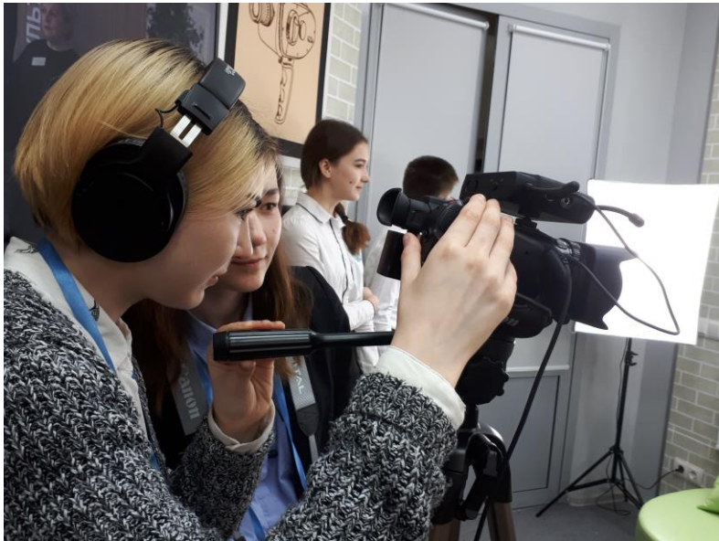
Съемочный процесс в действии