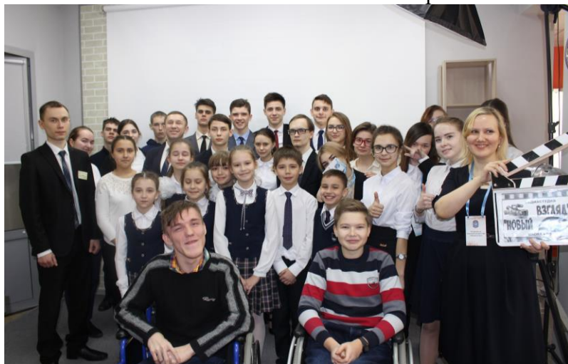
Дружная команда медиастудии «Новый взгляд»