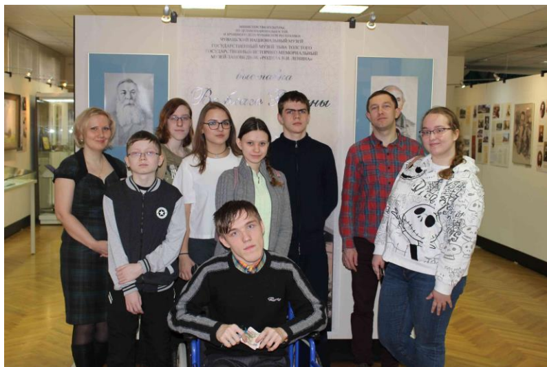
На съемках фильма, посвященного И.Я. Яковлеву