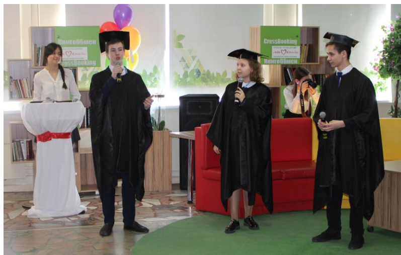
Участники литературной студии «Говорящее перо» на открытии медиастудии