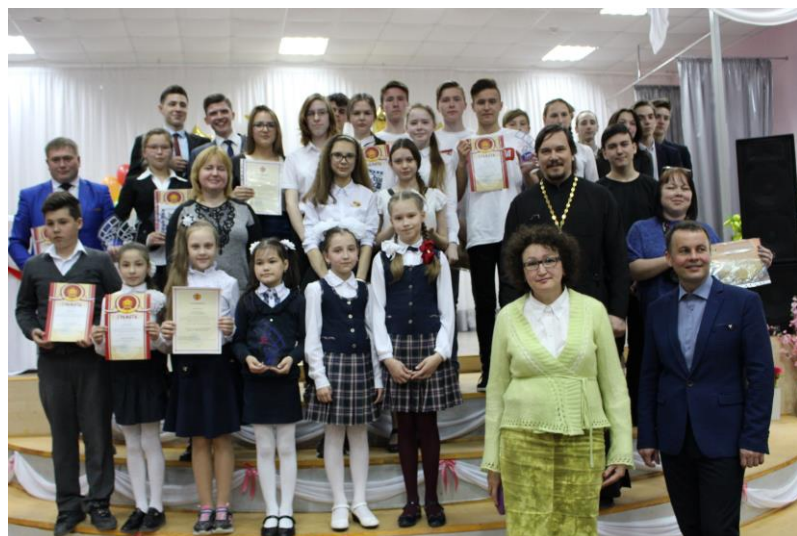
Победители и участники фестиваля с членами оргкомитета