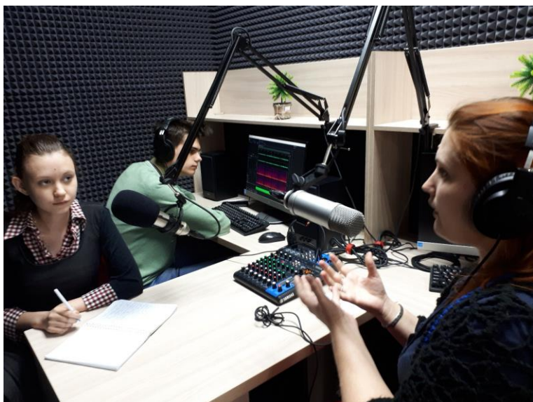
Запись радиопередачи «Мы творцы»