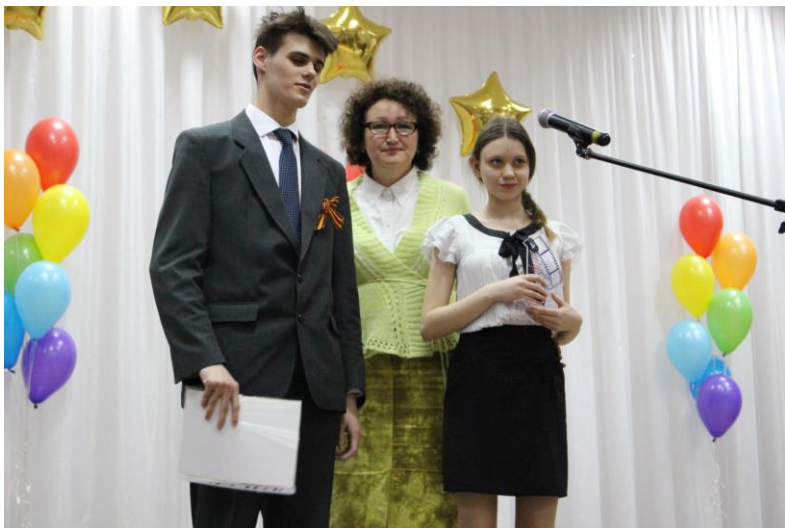
Получаем награду «Лучший документальный фильм» республиканского фестиваля юношеских СМИ «Новый взгляд»-2018