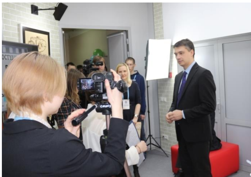
Интервью с Дмитрием Захаровым, начальником управления образования администрации г.Чебоксары