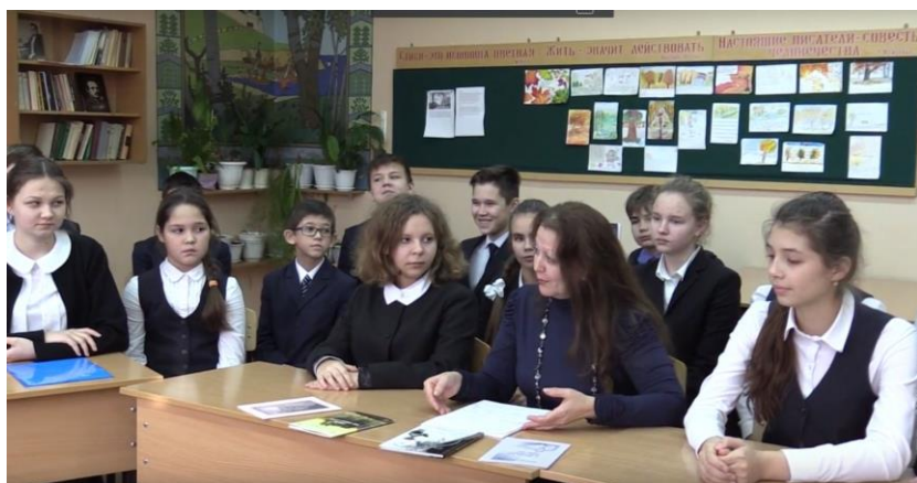
Собираем материал для электронного журнала «Собеседник»