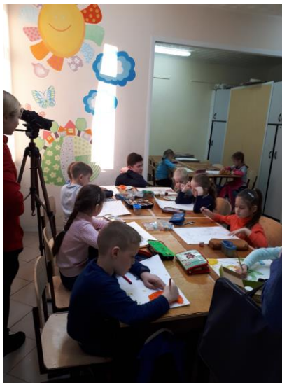
На съемках телесюжета о Чебоксарской детской художественной школе искусств