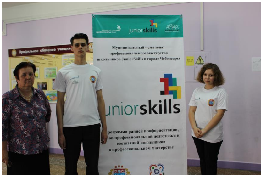
Участвуем в чемпионате JuniorSkills, компетенция «Мультимедийная журналистика»