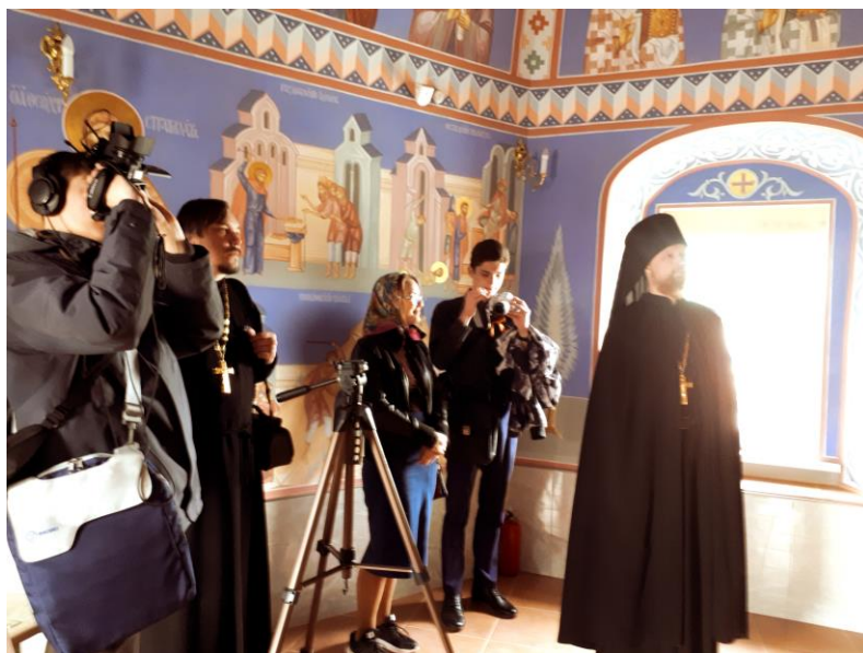
На съемках фильма о Свято-Троицком мужском монастыре