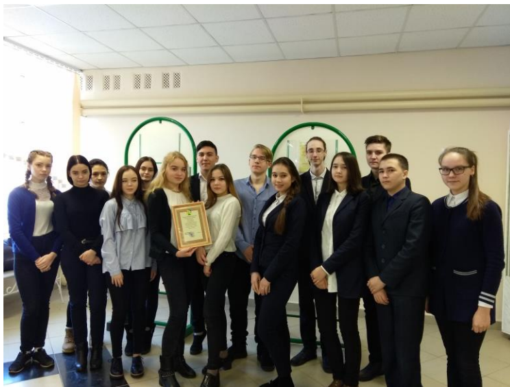
Наши ребята – добровольцы, активные участники городских мероприятий.