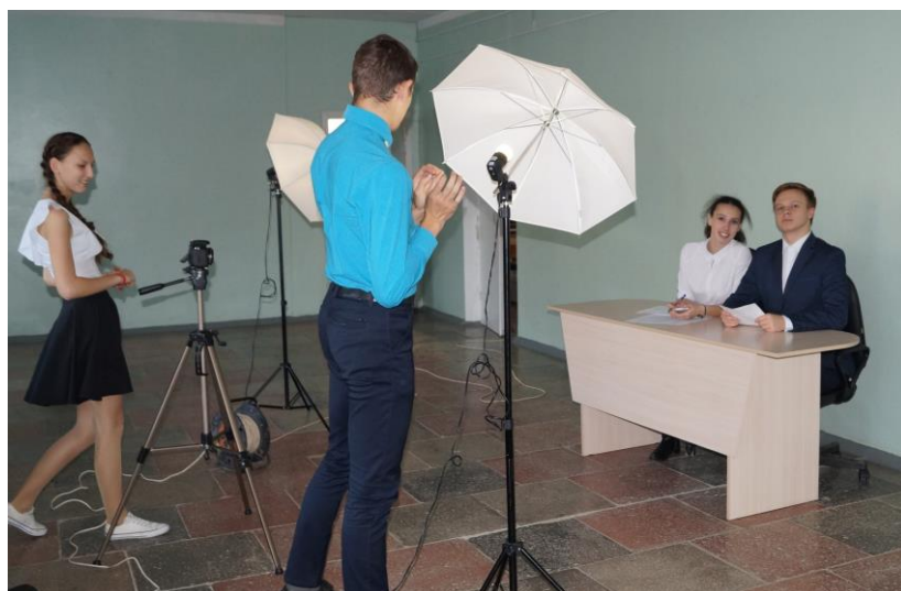
Съемки школьных новостей