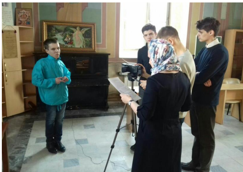
Снимаем фильм о завещании И.Я. Яковлева