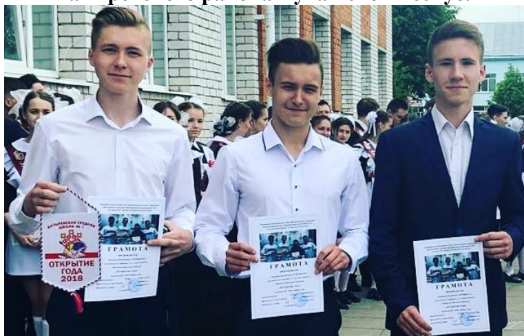
Участники «Телешколы» получают награду «Открытие года»