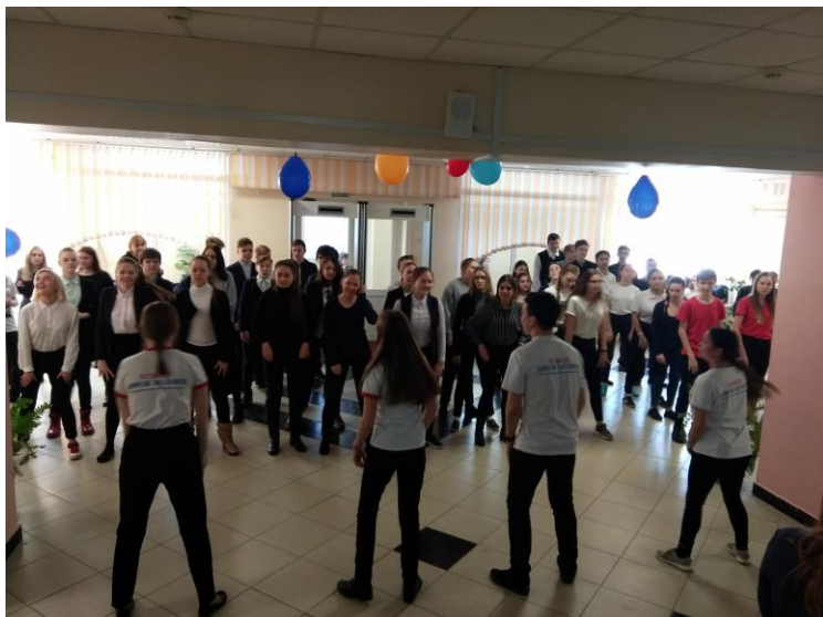
Журналисты зажигают! Или школьный флешмоб во главе с журналистами?