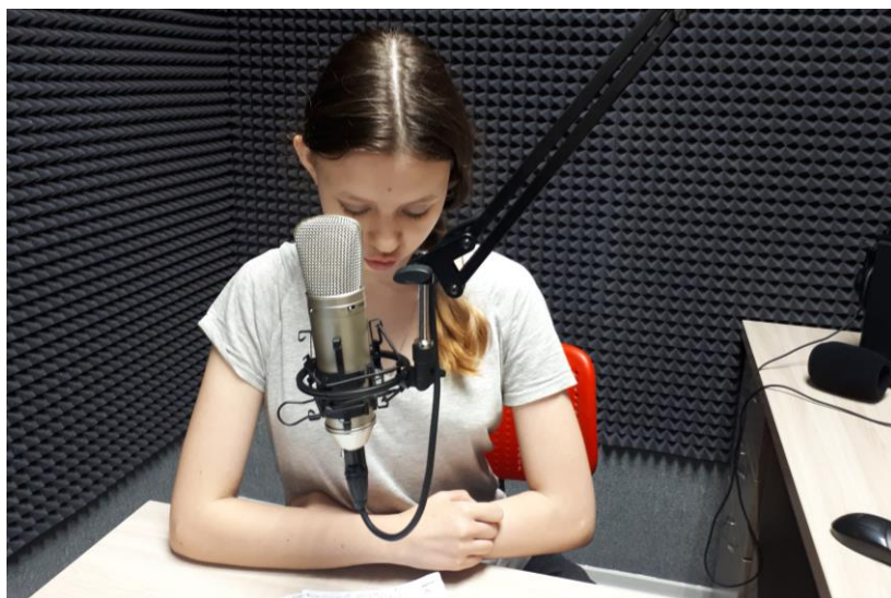
Готовимся к радиоинтервью