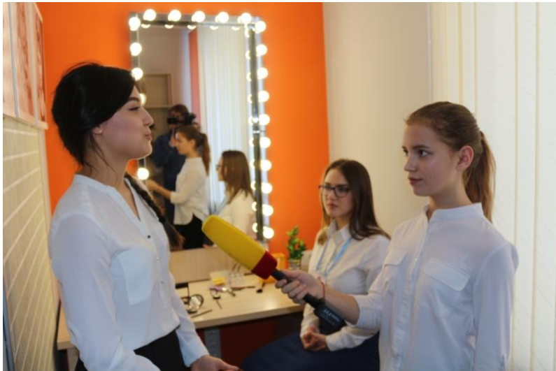
Наша уютная гримерка!