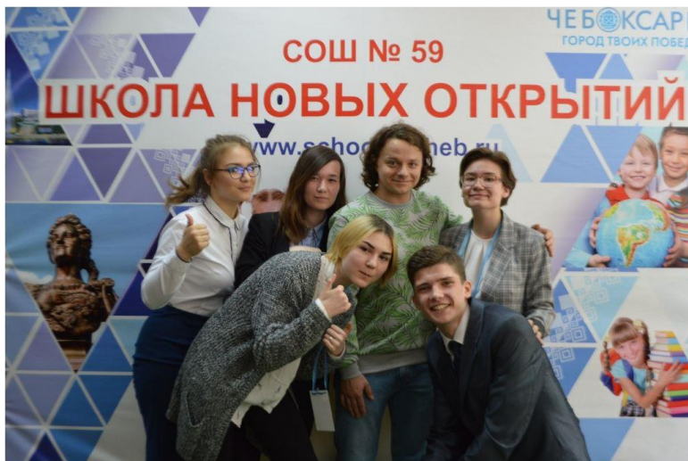
В гостях – Сергей Друзьяк, известный актер театра и кино