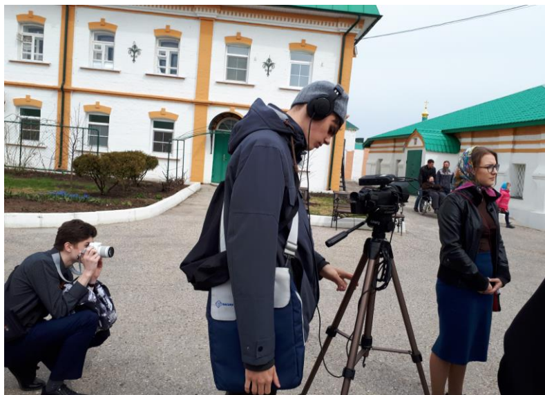
Собираем видеоматериал для будущего фильма