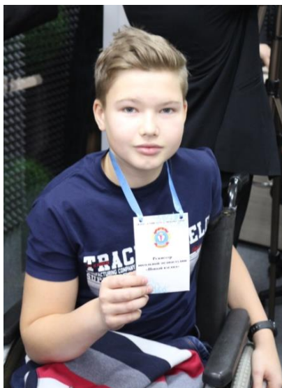
Лица школьной медиастудии «Новый взгляд»