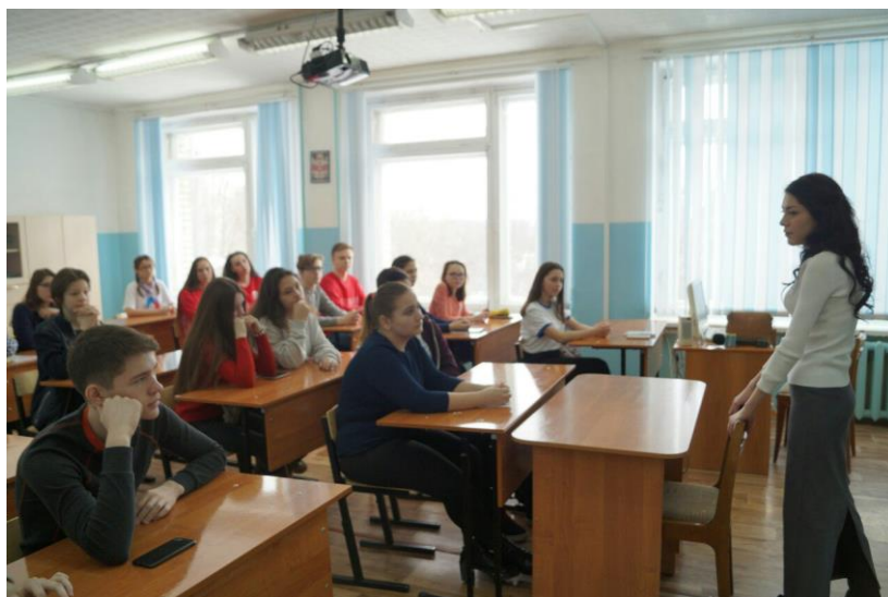
Мастер-класс НКТВ для активистов школьного ТВ