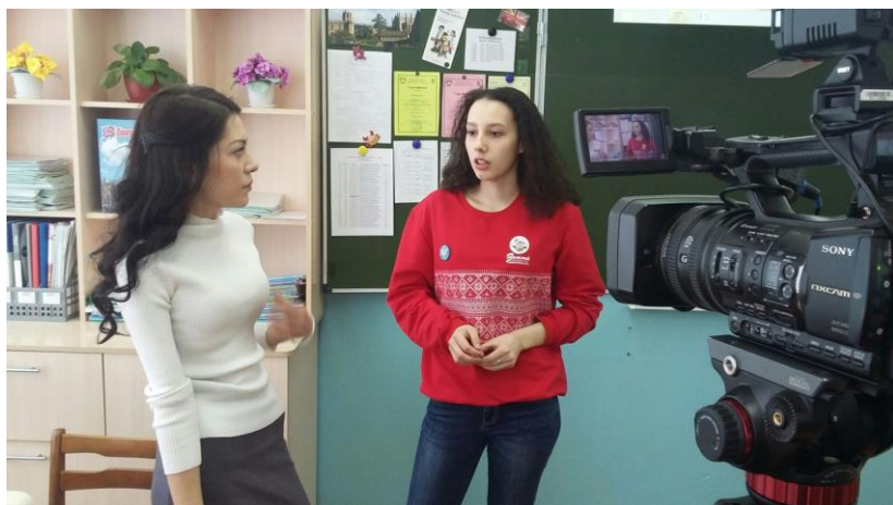
Городское телевидение берет интервью у школьного ТВ