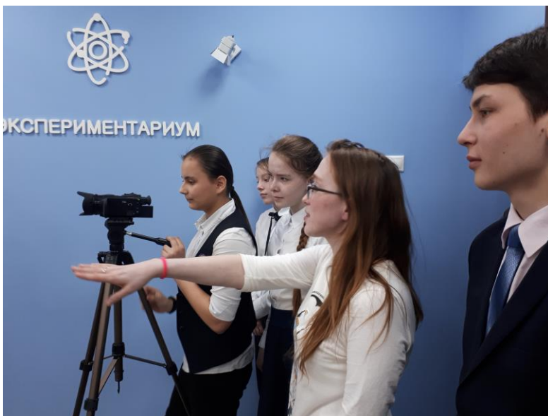
Мастер-класс специалистов телеканала ЮТВ и НТРК Чувашии для участников медиастудии