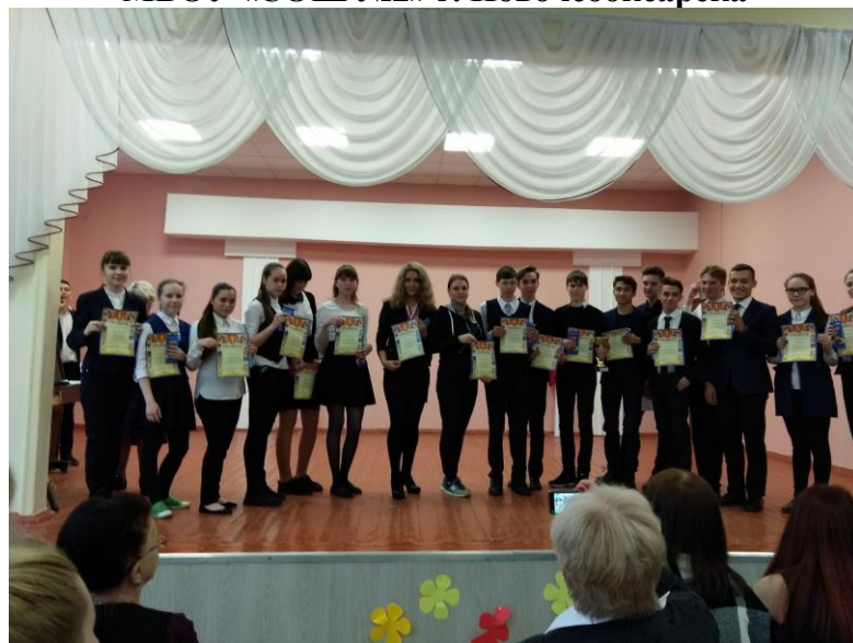
Награждение активных и творческих детей, и самые активные – это ребята школьного пресс-центра!