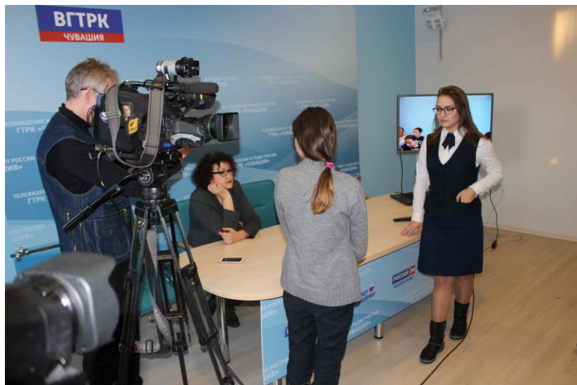
Мастер-класс специалистов ГТРК «Чувашия» для участников медиастудии